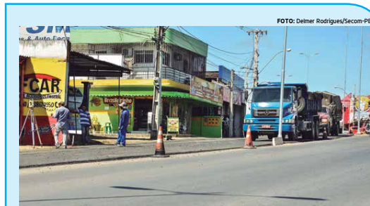
São feitos serviços de pavimentação, canteiro central, iluminação ornamental e calçadas

vida equilibrada, inclusive nas finanças pessoais. "A ideia foi mostrar aos participantes sobre como organizar melhor seus gastos e investimentos financeiros. Aqui não é um local para dizer o que e como fazer para ganhar mais ou economizar, ou solucionar as dívidas, mas como deve ser o procedimento com o dinheiro, de forma consciente, prática e eficaz", disse o palestrante. Logo depois da palestra, houve a cerimônia de abertura e bijuterias.