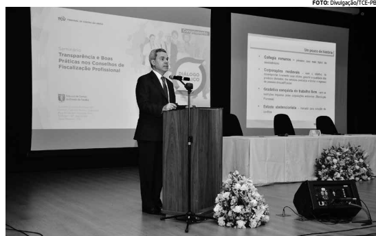
Ministro substituto Weder de Oliveira lembrou que o Brasil tem 535 conselhos de fiscalização

O seminário é aberto ao público e as inscrições podem ser feitas pelo e-mail: seminarioconvivencia-fc@gmail.com . Mais informações pelos telefones (83) 3222-8910 e 98892-8910.