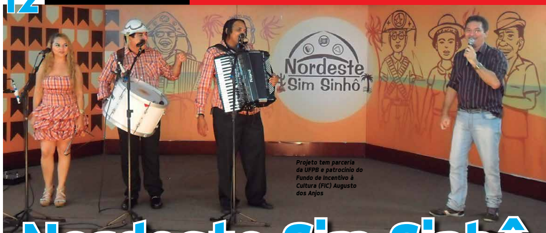
Projeto tem parceria da UFPB e patrocínio do Fundo de Incentivo à Cultura (FIC) Augusto das Anjos