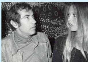
Roger Vadim em companhia da bela Brigitte Bardot

A musa de "Babette Vai à Guerra", estava sem nada por baixo. E Vadim diz, no seu livro, que não teve coragem de trair Sachs, mesmo com o consentimento dele. Bicho mentroso... Meses depois Vadim e Bardot conheceram François Mitterrand por acaso, quando este não era ainda presidente da França.