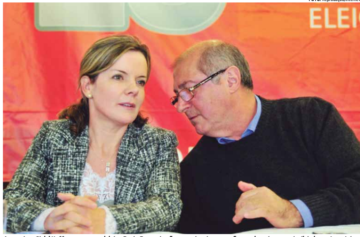
A senadora Gleisi Hoffmann e o ex-ministro Paulo Bernardo são acusados de corrupção passiva e lavagem de dinheiro na Lava Jato

Caso a denúncia seja recebida pelos ministros, os denunciados passam à condição de réus na ação. A data para julgamento ainda não foi definida. Na época que a denúncia foi apresentada ao STF, a