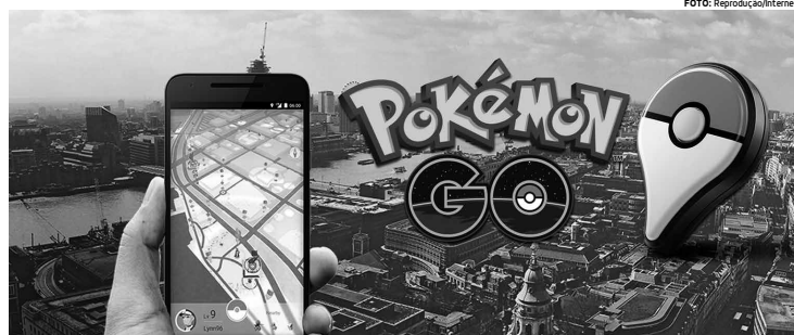
Os jogadores precisam repensar a prática do "Pokémon Go" durante alguns momentos. A falta de atenção pode gerar problemas graves

Por fim, vale dizer que grande parte dos gestores públicos brasileiros ainda acredita que vivemos os tempos de gastos irresponsáveis do desenvolvimentismo militarista brasileiro.